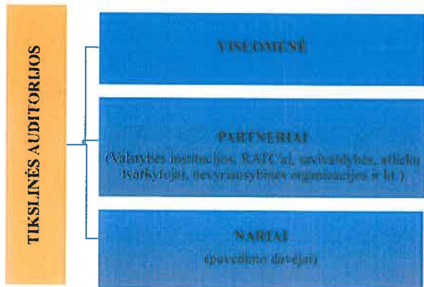
Schema Nr. 2. Organizacijos tikslinės auditorijos

Numatomos veiklos ir priemonės, kurias Organizacija sieks įgyvendinti visuomenės švietimo bei informavimo pakuočių atliekų tvarkymo klausimais 2015 m. programoje (žr. 1 lentelę).